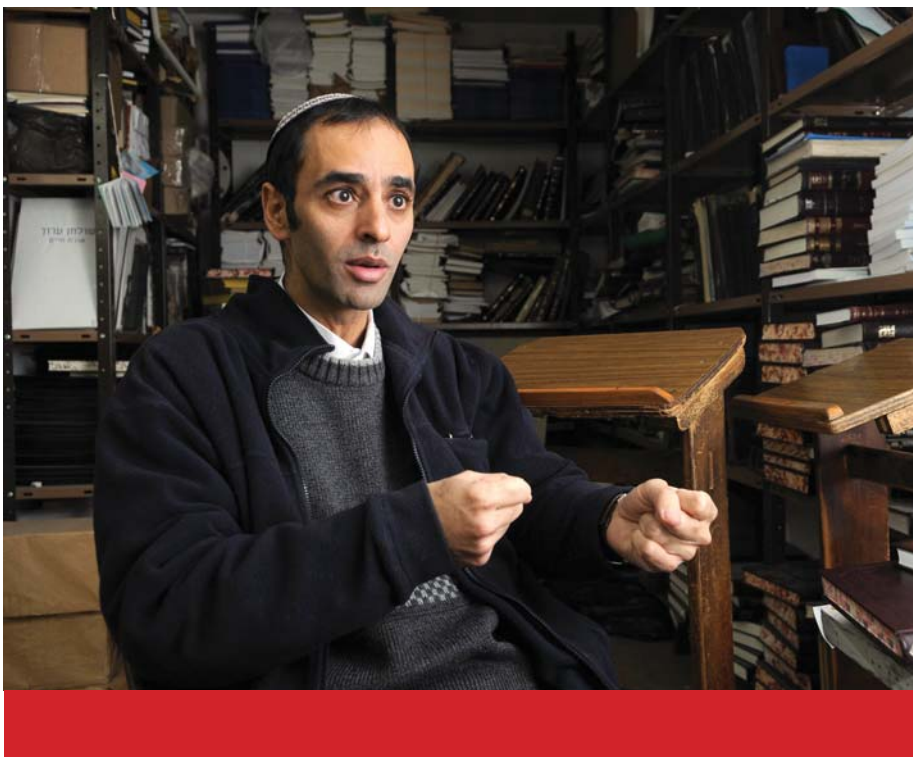
"היה פיגוע, אבא ב"ה בסדר". בנינת הספריה שהפכה לשדה קטל