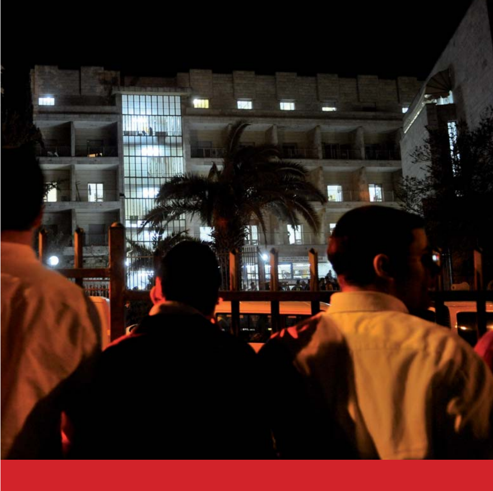
שלהבות שכבו. אנשים צופים באימה בישיבת מרכז הרב, לאחר הטבח. מימין: דדון מתאר את רגע שלילת האקדה. למטה: המדרגות שבהן התבצע המרדף